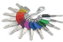
Der Schlüssel mit Largekey-Clip ist ebenfalls in 12 Farben verfügbar.