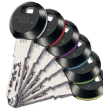
Bei den RFID-Transponder-Clips erleichtern 6 farbige Ring-elemente die Orientierung.