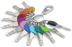
Für den Standardschlüssel gibt es Smartkey-Clips in 12 Farben.